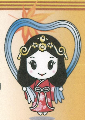
木津川市のマスコット 「いづみ姫」

主催・問合せ 木津川市かもまつり実行委員会 (木津川市商工会加茂支所) TEL 76-2970