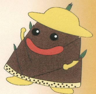
木津川市商工会キャラクター たけのこタッキー

主催・問合せ 木津川市やましろまつり実行委員会 (木津川市商工会山城支所) TEL 86-3157