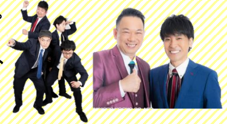
【ジョッキdeコーラ】 【ヘッドライト】

内容としては、今年のかもまつりの会場である恭仁宮跡を活かし「和」をテーマに開催いたします。