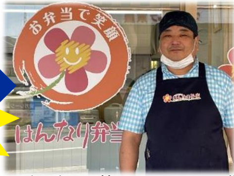
【はんなり弁当/(株)ソーシャルフード】

令和2年12月、加茂町の南加茂台で『はんなり弁当』という名前のお店がオープンしました。高齢者の方や健康に意識をされている方にむけて、体に優しい食材を選別しこだわって作っておられます。そんな中、新型コロナウイルス感染症の影響により、うまく営業活動ができず困っておられました。そこで、対面せずとも新規顧客を獲得するため補助金を活用しHPを作成し、ポスティングで地域の方や企業に宣伝をするためにチラシを作成することを考えられました。チラシに美味しそうなお弁当の写真を載せようと考えましたが、新規開業したところなので地域内に写真を撮ってくれるカメラマンがいるのかわかりませんでした。そのような状況の中、商工会に連絡があり、プロのカメラマンである林さんを紹介させて頂きました。『はんなり弁当』さんでは、お弁当配達は、コンビニや大手お弁当チェーン店と差別化を図るため、温かくお弁当を食べてもらえるよう工夫されています。お弁当の容器にはおかずだけを入れ、ご飯はジャーでお味噌汁はお鍋ごと配達することで、家で作って食べているような温かい雰囲気を感じることができます。ぜひ、一度ご利用してみたいはいかがでしょうか。