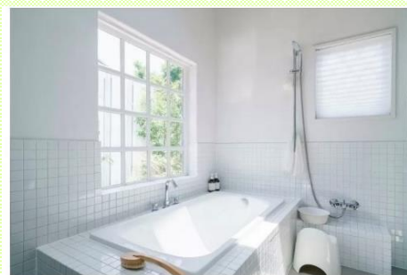
見た目も性能も整える水回りの改装工事

蛇口のパッキン交換から水まわりのリフォームまで、何でも承ります。 地域密着で長くお付き合いさせていただきたいと考えております。 よろしくお願い致します。