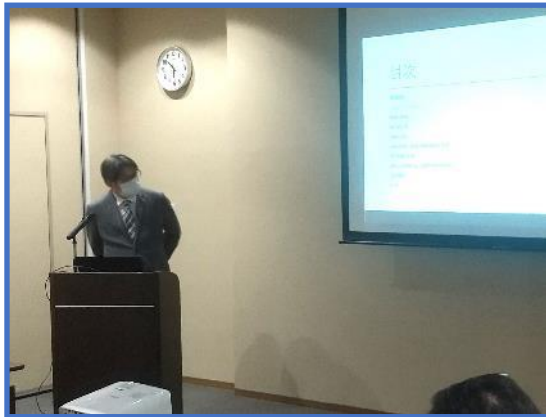
【中山経営支援員による事例報告】

事例発表では、支援員を代表し、中山経営支援員が金融経営一体型支援体制強化事業も含め多方面からの伴走支援を行った事例の発表を行いました。真の課題点を解決するための試行錯誤の課程など、他の支援員が参考とすべき内容で、非常に有意義な報告会となりました。