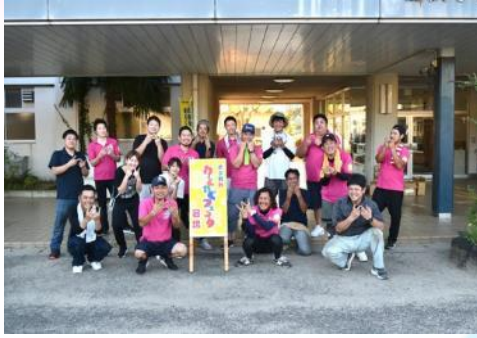
7月21日(日) わーくわくフェスタin加茂小学校