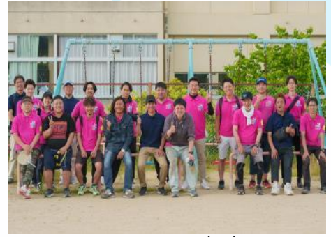
5月26日(日) わーくわくフェスタin高の原小学校

地域の子どもたちに「もっと郷土愛を育んでもらいたい！」という強い思いから始まったTSUMUGU(紡ぐ)プロジェクト。青年部員の事業活動を通じて、お仕事の楽しさを多くの方に体験してもらいました。